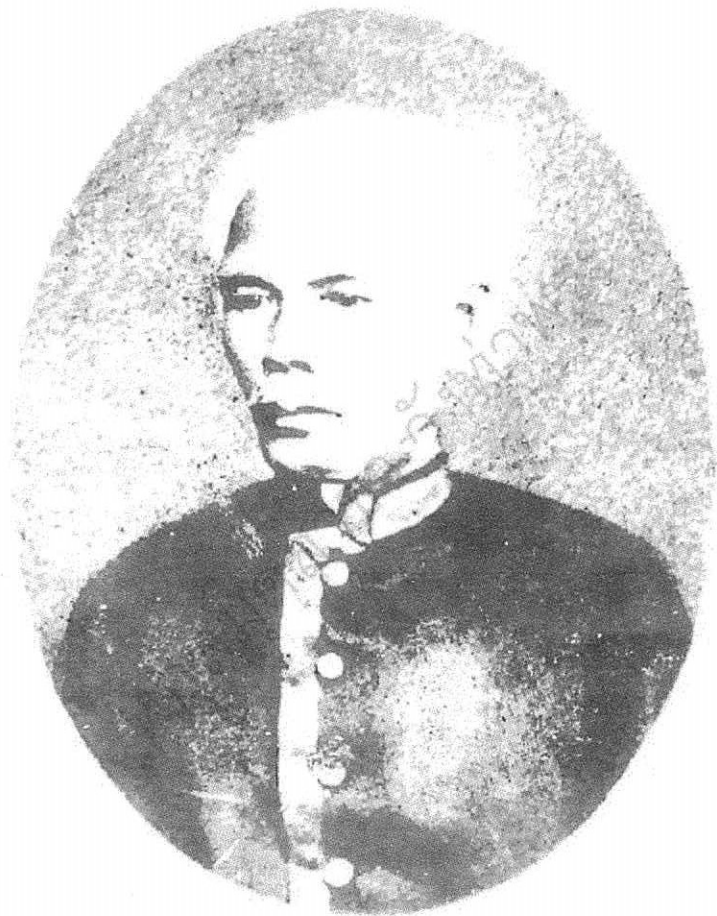
พระบาทสมเด็จพระจุลจอมเกล้าเจ้าอยู่หัว